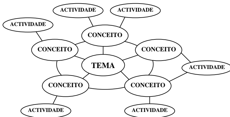
Figura 1 - Rede esquemática para a integração curricular