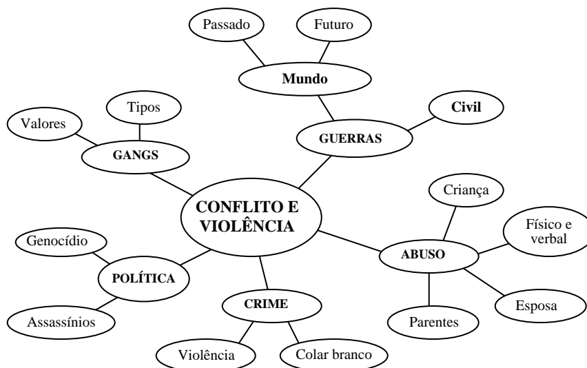
Figura 3 - Unidade temática “Conflito e Violência”: rede de conceitos, exemplos de questões e actividades.